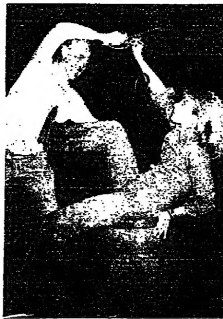
الشخصية الغريبة في مسرحية «بيتان» احتلت البريطانيون بها لحظة سوزان هامبشير.